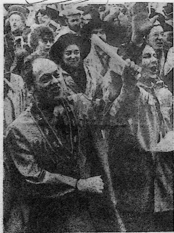
Les intronisés du jour prêtent serment